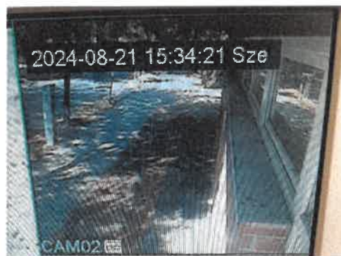
Camera 2: Jász u. Iskola hátsó bejárata