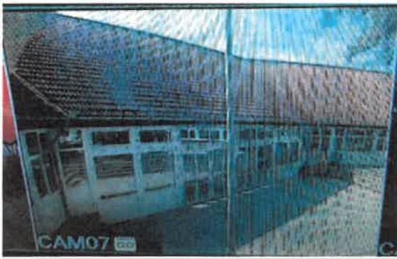
Camera 7 : iskola belső udvara