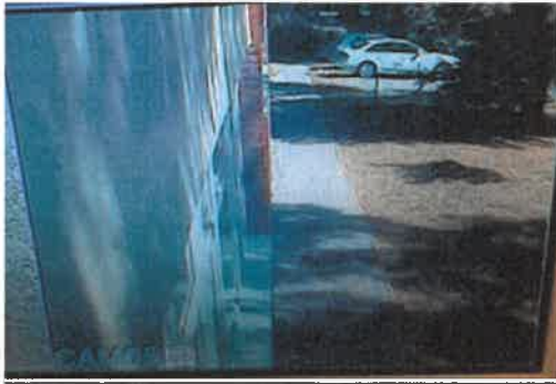
Camera 5: Futár u. oldalsó rész (ablakok)