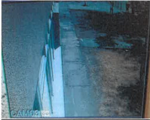
Camera 3: Jász u. oldalsó rész