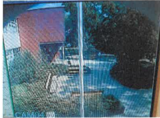
Camera 4: Futár u. iskola előtti kör terület