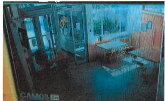
Camera 8: iskola belső bejárata (porta előtti rész)