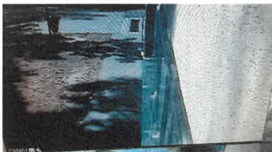
Camera 1: Futár u. 18.előtti területet veszi

Az egyes kamerák által belátható, rögzített területet, a kamerák látószögét az alábbi képek mutatják: