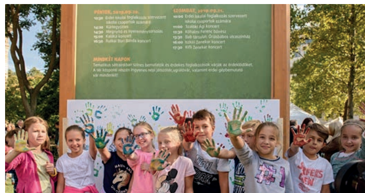
Hunyadi Mátyás Általános Iskola 4.b osztálya

Örülünk, hogy részesei lehettünk ennek a kezdeményezésnek, s mi is hozzájárultunk a Föld megóvásához. Reméljük jövőre is ott lehetünk!