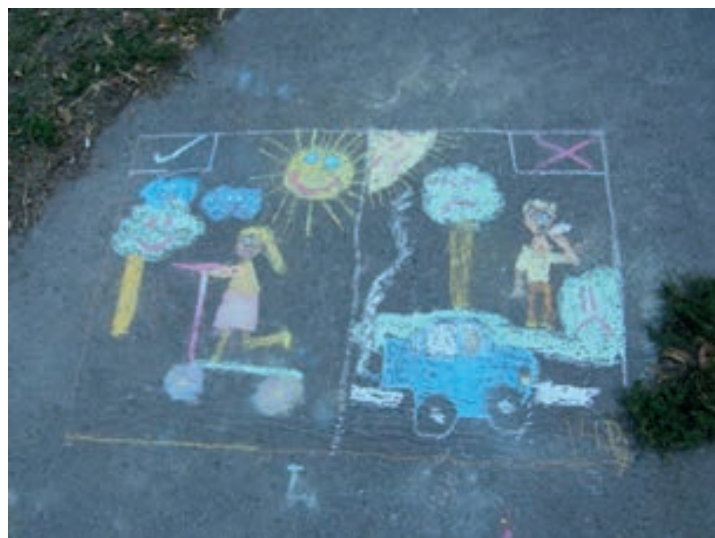
Csürke Gyöngyvér Öko munkacsoport

A legkisebbek pedig színes aszfaltrajzokat készítettek az iskolát körülvevő járdákon az autómentes közlekedés formáiról és a környezetvédelemmel kapcsolatban.